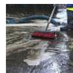
Gülle-Unfall im Eifelend