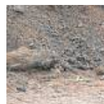
Fünf-Zentner-Bombe in Euskirchen entschärft