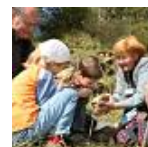
Archäologietour in der Nordeifel