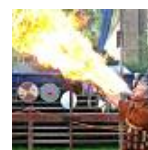
Wikingerspiele auf Burg Satzvey