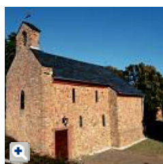
Die St. Petrus-Kapelle wurde seit dem Frühjahr umfangreich renoviert.

Nach Abschluss monatelanger Renovierungsarbeiten wird Pfarrer Burkhard Möller am Mittwoch um 18 Uhr in einer von ihm zelebrierten Messe die Wachendorfer St. Petruskapelle einsegnen. Die erste urkundliche Erwähnung der Kapelle datiert aus dem Jahr 1680.