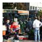
Busunglück in der Euskirchener Innenstadt