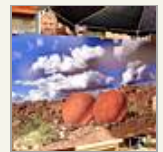
Kaller Herbstschau und Kunstmeile