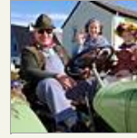
Erntedankzug Harperscheid & Schönesseiffen