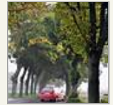
Herbstimpressionen aus der Nordeifel