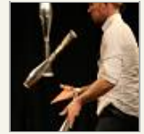
Bilder der Woche 38/2010