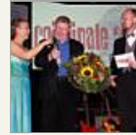
Bilder der Woche 37/2010