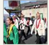
Bilder der Woche 36/10