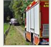
Tanklastzug fuhr sich fest