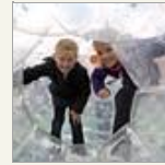
Bilder der Woche 39/2010