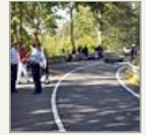
Schwerer Unfall bei Ahrhütte