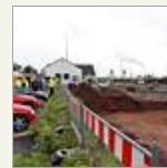
Bombenfund am Euskirchener Bahnhof