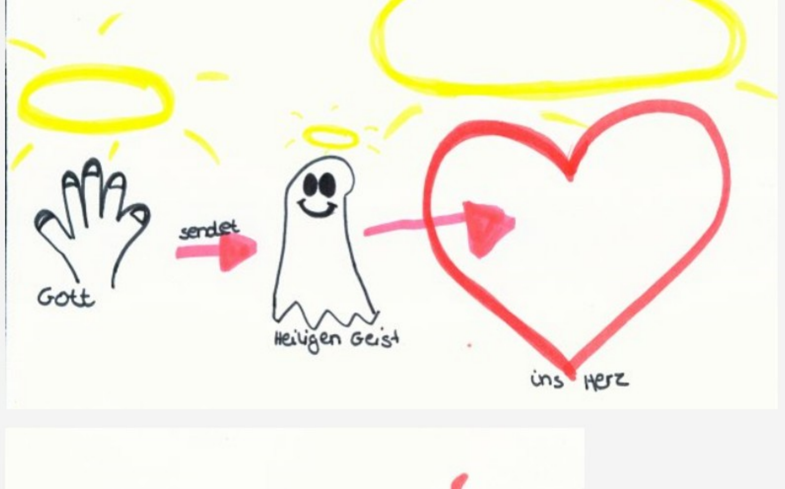
Firmvorbereitung am 20.3.2010 zum Thema Heiliger Geist - Grundschule Kommern